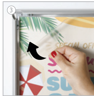
Inserire il poster e il foglio di protezione nella cornice