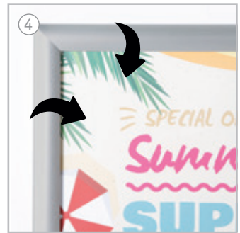
Chiudere tutti i profili